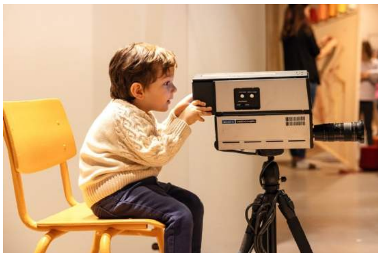
Opening Lichtspielplatz 2023

Lichtspeelplaats is onze eerste grote expositie voor kinderen van 3-7 jaar en stond al een paar jaar op ons wensenlijstje. We zochten naar een manier om op een duurzamere wijze dan voorheen met onze festivaltour een groots landschap samen te stellen met onze installaties, speciaal voor jonge kinderen. De vraag vanuit het Duits Filmmuseum in Frankfurt (DFF) om gezamenlijk een tentoonstelling te ontwikkelen en op te bouwen, bood de kans om de wens te realiseren. De expositie was meer dan het programma van film en spel. Er werden ook twee onderzoeken, een seminar en een randprogramma aan verbonden.