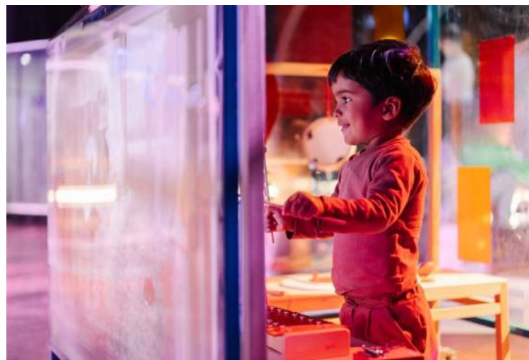
Fotograaf: Almicheal Fraaij / Festival 2023

Het festival werd goed bezocht. Om iedereen de gelegenheid te geven om aan het publieke deel te nemen, werkten we net als in 2023 samen met Humanitas. Helaas kwamen er minder mensen dan voorheen via deze bemiddelaar. Omdat het niet noodzakelijk is om de Nederlandse taal te beheersen was het festival erg aantrekkelijk voor families die thuis geen Nederlands spreken. Het festival werd dan ook goed bezocht door de internationale gemeenschappen die in Eindhoven wonen.