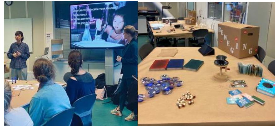
Taartrovers Training Spelen met Film