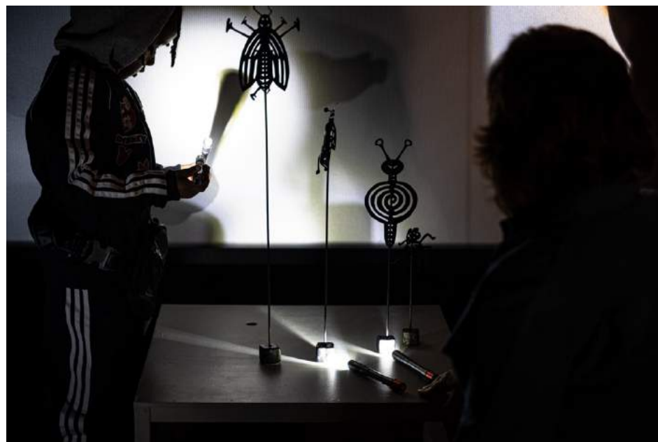
Kriebelkabinet op Cinekid 2023

expositie in Frankfurt. We openden de deuren van Club Taartrovers , een culturele club speciaal voor nieuwkomers in Amsterdam Noord. Hiermee maakten we een diepe en langdurige verbinding met de leerlingen van de Taalschool, samen met hun ouders. Naast de projecten zetten we nieuwe stappen om de structuur en diversiteit van onze groeiende organisatie beter vorm te geven. We besteedden ook veel aandacht aan uitwisseling van lessen, kennis en ervaringen met onze (internationale) partners. Met Filmhub Midden en Filmhub Zuid-Holland ontwikkelden we hiervoor de hands on training Spelen met Film .