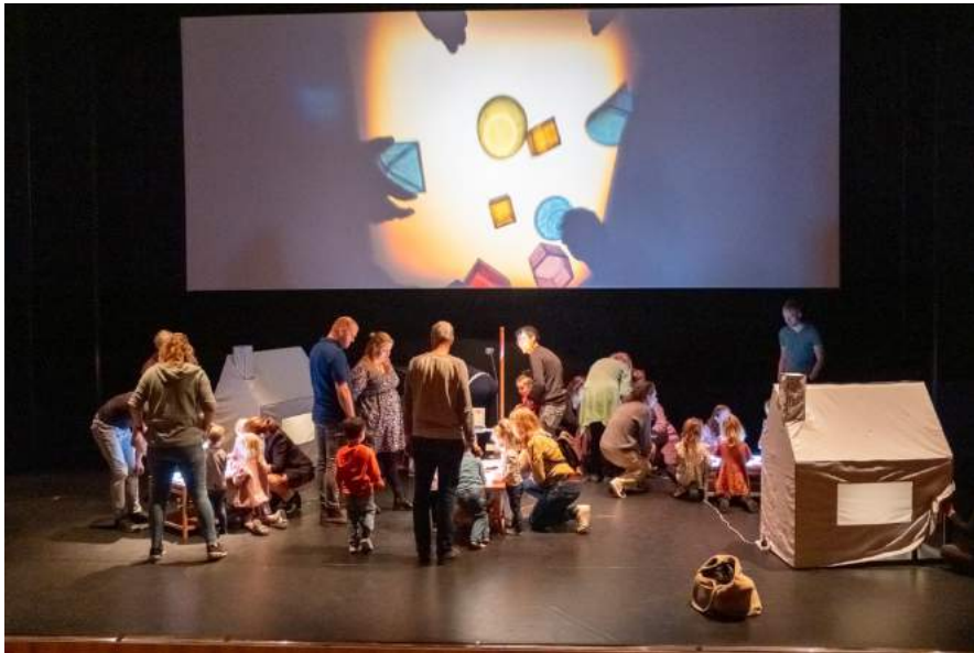
Fotograaf: Peter Voorn / Taartrovers Cinemini in de Gigant 2023

Taartrovers ontwikkelt actieve filmprogramma's waarin jonge kinderen onderzoeken, verwonderen, spelen, maken en ontdekken met gebruik van al hun zintuigen. Zo kunnen ze uiting geven aan hun gevoelens, ideeën, beelden en verhalen. Taartrovers wil kinderen bereiken op alle plekken in onze samenleving en geeft speciale aandacht aan kinderen die kwetsbaar zijn, omdat juist zij onze programma's hard nodig hebben. In 2023 ging veel van onze aandacht naar nieuwkomersgezinnen.