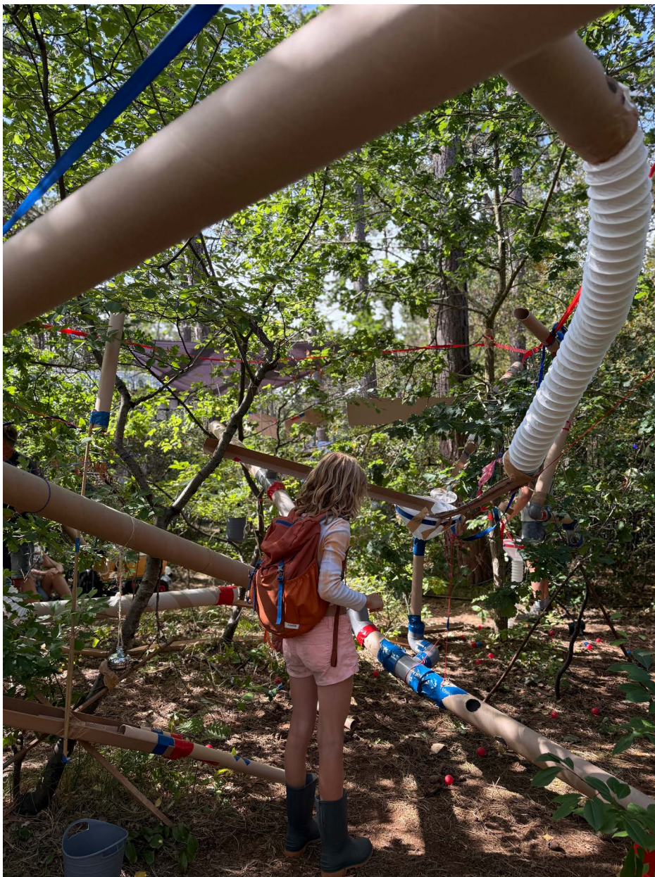
Beeld: Esma Yildirim Atak